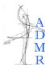
Association Danse Médecine Erborbio