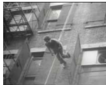
Trisha Brown, Man Walking Down the Side of a Building , New York, 1970