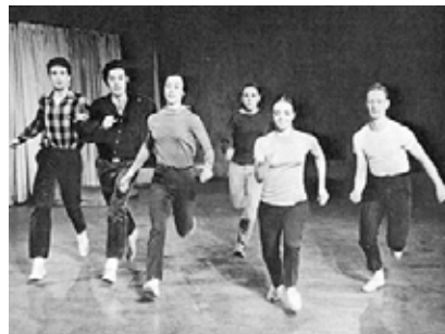
Yvonne Rainer, The Mind Is a Muscle (first version), Judson Church, New York, 1966

La danza è da sempre strumento comunicativo del corpo, definizione del sé e mezzo celebrativo del gruppo. Attraverso la danza un popolo esprime la sua identità, la sua memoria, i suoi miti e i suoi riti affermando il proprio patrimonio culturale. Per rispondere ad un diffuso disagio sociale tra crescente individualismo e bisogno di aggregazione e appartenenza, la danza di comunità, attraverso il movimento creativo, si propone di trovare nel corpo uno strumento immediato per migliorare le relazioni interpersonali, assicurando il riconoscimento del sé, del gruppo e la valorizzazione culturale della comunità agendo nei contesti di emergenza, disagio, detenzione, educazione ed interculturalità. L'Associazione Culturale Danzarte di Brescia, in collaborazione con Istituzioni Pubbliche ed Universitarie, docenti universitari, ed esperti di danza di comunità, professionisti della danza contemporanea e del teatro danza, pedagogisti, operatori e formatori di danza nel sociale, artisti del movimento, vuole creare nuove figure professionali di artisti di danza aggiornati e specializzati, capaci di operare nell'ambito sociale. Il corso si rivolge a danzatori, insegnanti di danza, educatori ed artisti del movimento, insegnanti di area motoria che desiderano agire nel e per il sociale ed ampliare le proprie competenze artistiche e pedagogiche, approfondendo il ruolo attivo dell'artista di danza nei luoghi delle dinamiche sociali.