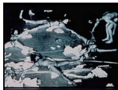
Carolee Schneeman, Meat Joy New York, 1964